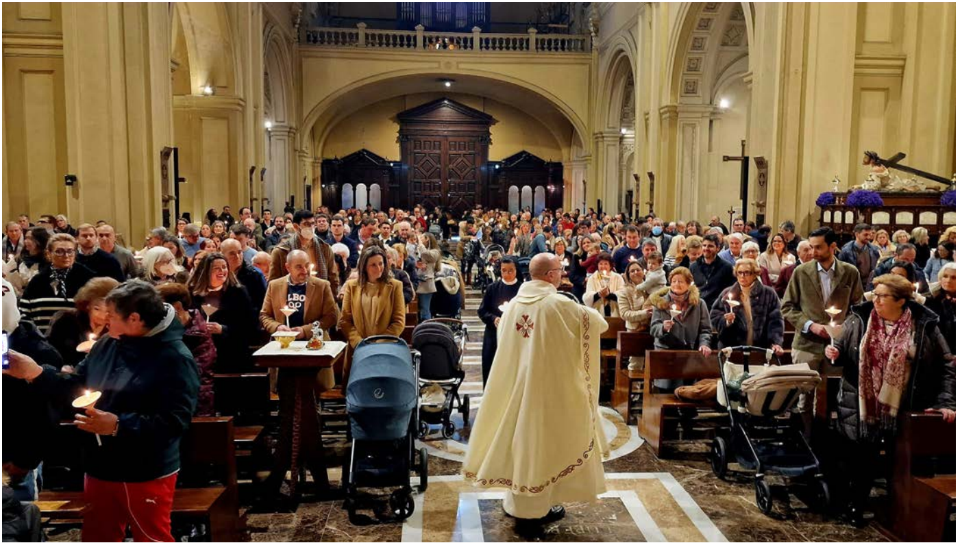
Dios nos llama a la vida y a la fe: Imposición del escapulario a los niños bautizados en 2024